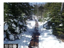
整備後 木道が設置された登山道