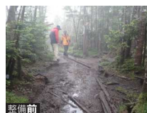
整備前 路面が洗掘された登山道

平成 29 年度の登山道整備には 株式会社モンベル様 三峰川電力株式会社様 銀河ソフトウェア株式会社様からの 寄付金が活用されて 整備が進められました